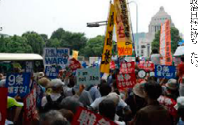
国会議事堂前で、安全保障関連法案に反対する数万人規模のデモが行われた。

国家緊急権とはなにか。簡単に言えば、国民の意思にもとづく政治・行政を建前にしているはずの民主政治のなかで、国家を国民から独立した法人として捉え、国家が国民の意思に由来しない統治・