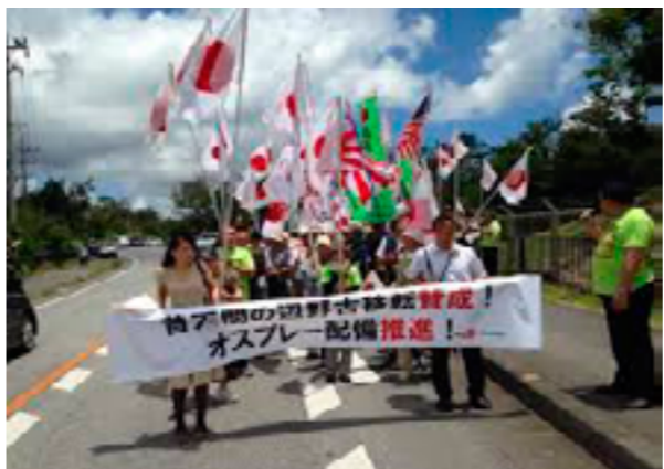
2015/5「頑張れ日本! 全国行動委員会」呼び掛けのキャンブ・シュワブゲート前デモ行進で新基地賛成を訴えました。

この「辺野古新基地建設」容認の決議だが、11月29日の辺野古反対の東京集会に参加したとき、東京の女性市議員が自民党系系派が議会で建設容認の意見書の採択活動をしていると、その活動に警告を発していた。