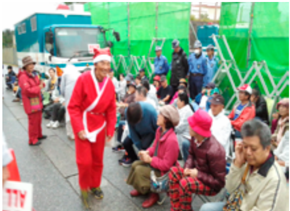
サンタも登場したある日の辺野古ゲート前