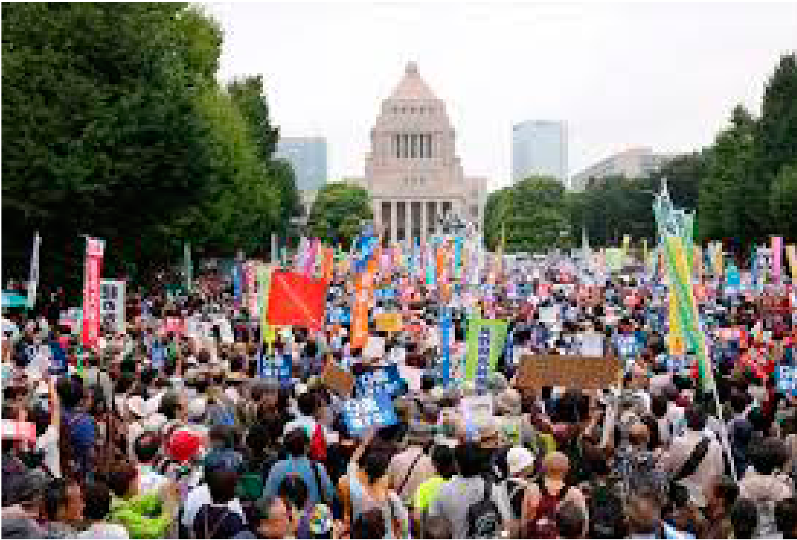
2015/8/30 国会前は人があふれ、安保関連法案に反対の声を上げた＝