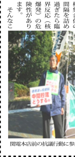
関電本店前の抗議行動に参加した筆者

レイメイカメラが何台も前を通り過ぎました。カメラは威容を誇る関電ビルを必ず写すのですが、抗議行動は見えないかのように避けます。テレビカメラがとらえる「事実」なんてそんなものです。 稼働している高浜原発3・4号機はウラン・プルトニウム混合酸化物(MOX)を燃料としていますが、そのMOX燃料の値段が5倍に高騰、1体10億円超とか。1999年に東電が福島第一原発で使用した時は2億3443万円だったというから、電力資本は泣いているでしょう。ウラン燃料でいいのに、その数倍以上高いMOX燃料を「国策」で使用しているのですから、経済性はボロボロです。 残った大飯原発3・4号機、美浜原発3号機、高浜原発1・2号機は審査合格で、稼働に向けて動いているのです。しかし、電気は足りてくる(余っている)のにそんなに再稼働してどうするのでしょうか。一層の値下げで競争に勝とうというのか、オール電化で消費喚起するの。一方で、関電ガスを売り込んでいますのだから、オール電化推進はまずいのではない、何と心配してやる必要もないの