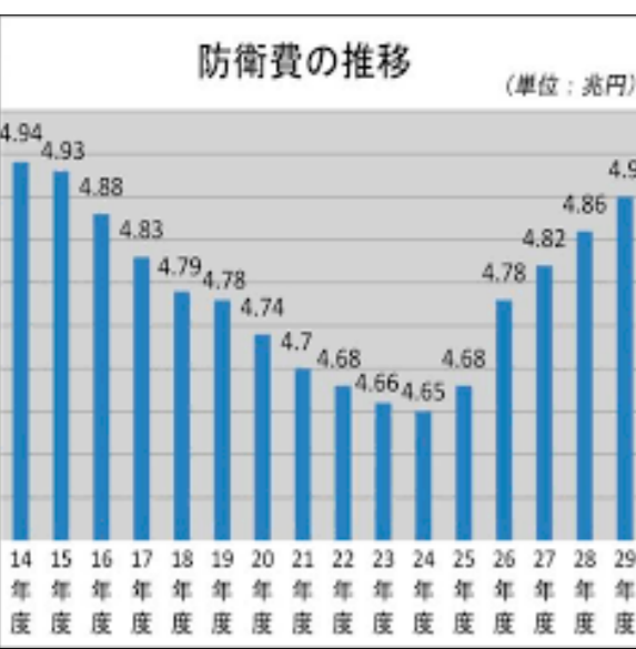
軍拡まっしぐら 防衛費の推移

「危険と思われるものは何でも撃て」という上官の命令に従い続けることに疑問を感じ、「自分はテロリストと闘うという任務で戦地に赴いたけれど、実際自分がやっていることがテロ行為ではないか？」という考えにたどり着いた。