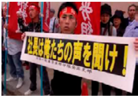
労働組合の組織率が6年連続で低下！組合の割合は約17.1%、加盟者数は998万1000人

上でトラブルがあった時、個人ではいえないことを経営者に申し立てて交渉する組織が労働組合です。」(12月16日朝日新聞)と説明している。ここで龍井氏は、個人と労働組合を併記している。個人と労働組合は別物だ。また、「個人では言えないこと」を代理する存在として労働組合を位置づけている。