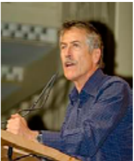
アラン・リビエツツ (本名、アラン・ギー・リビエツツ、Alain Guy Lipiec、1947年9月19日 - )

ます。そこで新年を迎え、改めて労働者の基本的立場から「働き方改革」をどのように考えたら良いのか考えて見たいと思います。今回はレギュラシオン派の経済学者であり、社会運動家として積極的に発言しているアラン・リビエツツの所論を参考にいたします。(アラン・リビエツツ)