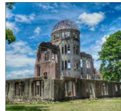
(下) 被爆被害を象徴する原爆ドーム

この75年の間に、「記憶」そのものが選別されてきました。その上に「被爆ナショナリズム」も成り立っている。しかも、韓国の歴史学者・権