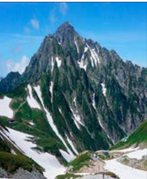
立山別山から見た剣岳

私は子育てや介護が ここ10年位毎年夏季休 使って連れ合いと山歩 てリフレッシュをして 6月コロナの感染者が ち着いたので今年計画 た山小屋に連絡すると コロナ対策として完全 宿泊人数を制限し、寝 し出しはできなく寝袋 するようにということだ