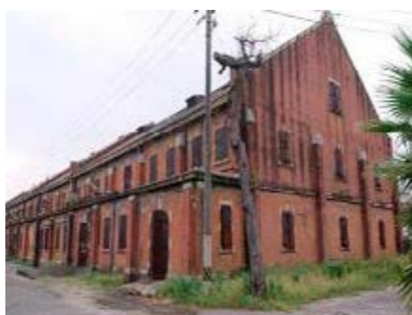
(上) 旧広島陸軍被服支廠 (下) 被爆被害を象徴する原爆ドーム