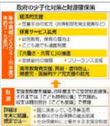
(別表) 1 政府の少子化対策

本論に入る前に、アベノミクスの「異次元の規制緩和」での2%の物価目標、岸田政権の「異次元の少子化対策」での出生率の向上にしても、なぜそれを