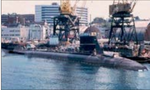
川崎重工神戸工場に停留する潜水艦

集団的自衛権行使の拡大解釈、自衛隊の南西シフト、防衛予算倍増、先制攻撃に道を開いた「敵基地反撃能力」、仮想敵国を想定した多国間による軍事演習の増加などだ。