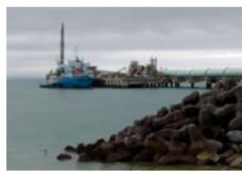
安和棧橋起こったと聞き、大変驚いた。